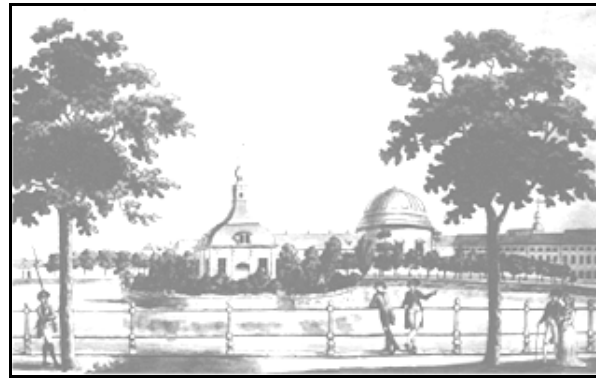
Ansicht der Französischen Kirche über das Bassin, Ende 18. Jh.

Identität jenseits der Kasernen. Hier kann angeknüpft werden, sowohl für die europäische Integration wie für heutige Immigrationsprobleme.