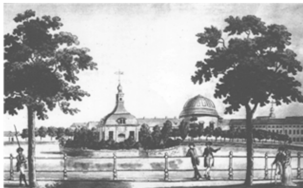
Blick op de Franse kerk over het Bassin , eind 18e eeuw

Onze kerk is een verwezenlijking van het Edict van Potsdam . Dit edict reguleerde de immigratie van om hun geloof vervolgde hervormden uit Frankrijk. De Franse Kerk was een belangrijk onderdeel van een uitgebreid integratieprogramma. Dit programma bezorgde Potsdam een goede reputatie en bepaalde mede het karakter van deze garnizoensstad. Zo is de toenmalige situatie in Potsdam een voorbeeld voor de huidige Europese eenwording en immigratiepolitiek.